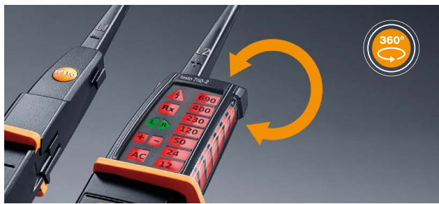
Spannungsprüfer testo 750-3 mit LED-Rundum-Display, tiefsitzendem Anti-Rutsch-Ring und ergonomischer Griff-Form.