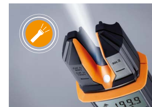
Spannungsprüfer und Strommessgerät in einem: Multitalent testo 755 für fast alle elektrischen Messaufgaben.