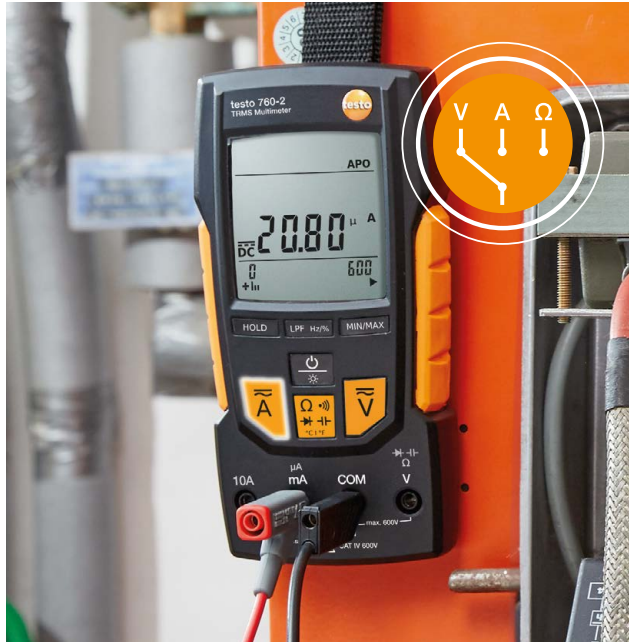
Digital-Multimeter testo 760 mit automatischer Messgrößen-Erkennung für größtmögliche Sicherheit bei jeder Anwendung.