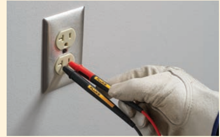
Messspitze für CAT II-Messungen verlängern