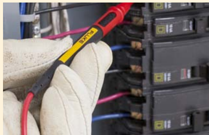
Messspitze für CAT III-Messungen verkürzen