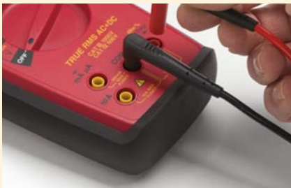
Universelle Stecker passen in alle abgeschirmten 4mm-Stecker