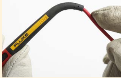
Extreme Zugentlastung, für über 30.000 Biegungen geprüft